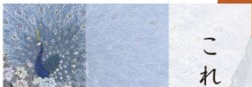
The bright future