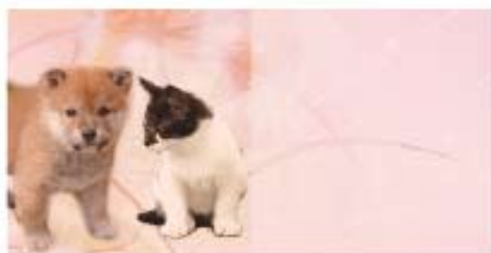
About a pet